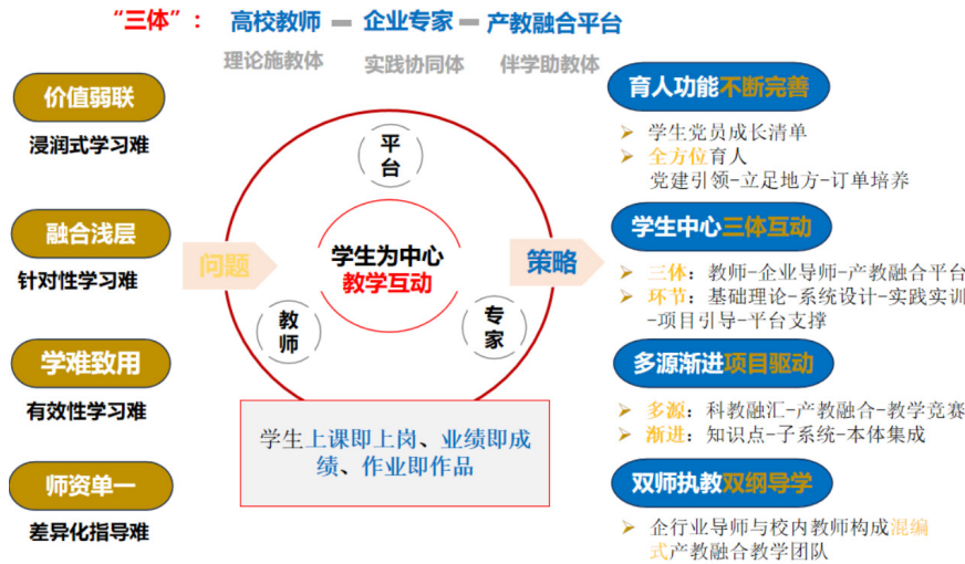
图 1 国际贸易实务课程产教融合教学体系

真问题、开展项目真研究、锤炼师生真本事，全方位展现校内教学与产业界互动互融互促。学生在真实场景下真学真做，达到真企真训、真题真做，做中学、学中做。学生上课即上岗、业绩即成绩、作业即作品，实现课堂与工作场所、学生身份与员工身份、企业文化与校园文化的“三融合”，助推“课堂革命” [3] 。